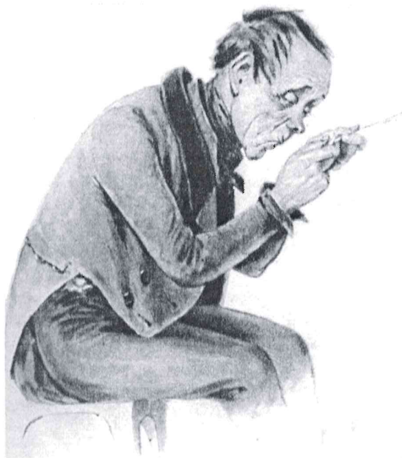
П. Боклевский. Акакий Акакиевич

(Обращение к иллюстрациям к повести «Шинель» , размещённым на доске.)