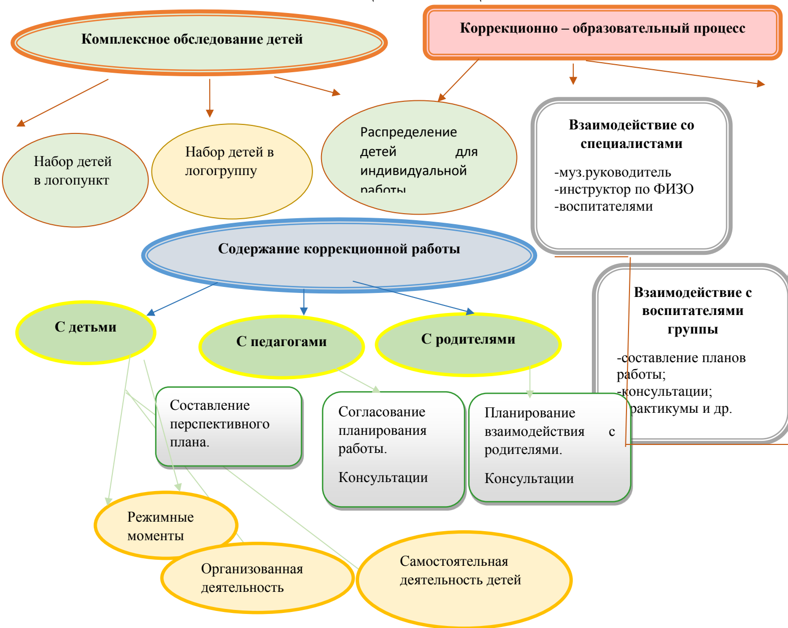
СХЕМА ОРГАНИЗАЦИИ КОРРЕКЦИОННОЙ РАБОТЫ