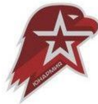
Орленок Юнармии – младший символ в ряду старших и великих

На Руси изображение двуглавого орла появилось в XV веке на печати Великого князя московского Ивана III Васильевича. Орёл становится гербом и символом Государства Российского.