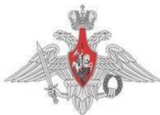
Орел Минобороны России – официальный символ Министерства обороны Российской Федерации