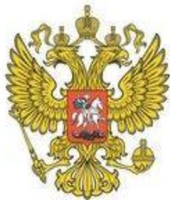
Государственный Орел – официальный государственный символ Российской Федерации