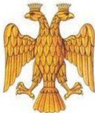
Государственный Орел – герб Великого князя московского Ивана III Васильевича